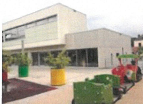
cycle 1 éducation précoce