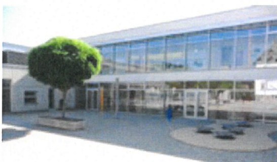
cycles 2 et 3