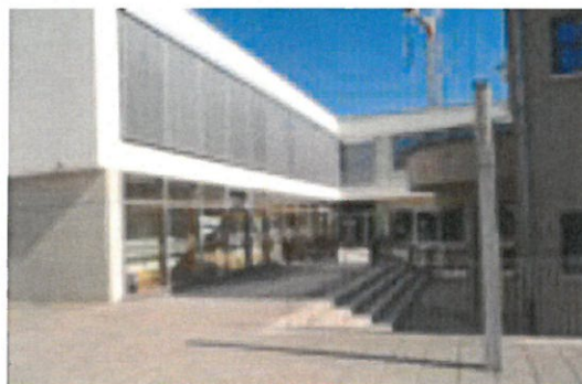
cycle 1 éducation préscolaire